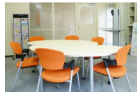
▲ オープンスペース