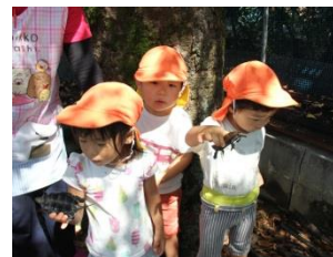
イシガメさん元気に大きくなってね♪