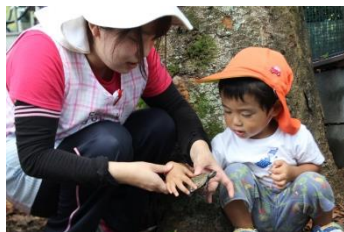
カメさんの甲羅の横をしっかりと持ってね。