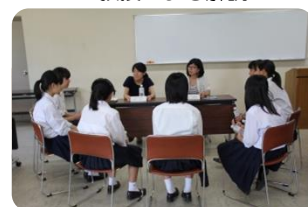
▲ 女子大学院生との交流会