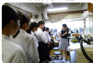
▲ 食成分機能化学研究室