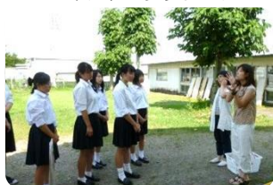
▲ 応用生物科学部附属農場