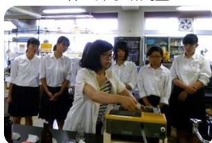
▲ 動物栄養学研究室