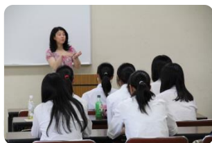
▲ イントロダクション

オープンキャンパスでは見られない研究室まで見学できて、環境や設備を知り参考になった。/色々な実験器具が置いてあり、研究している大学院生は「格好いい」と思った。/今までは研究といっても具体的に良くわからなかったけれど、はっきりとしたイメージを持つことができた。/今回の見学を通して、自分が大学に進学した後にどんな研究をしたいかを考えることができた。/大学院生の話を聞き、とても参考になった。研究室も見せてもらい、将来を想像することができた。/自分も大学院で研究してみたいと思った。受験についての話も聞いたので、今後役に立てたい。