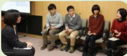
▲▼真剣に質問をする受講者との確に答える講師の様子

講演会終了後には、講師と学生の交流会が開催され、企業選びのポイントや企業での研究活動等についての質疑応答が活発になされました。