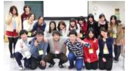
▲参加スタッフ集合写真