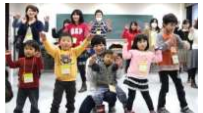
▲ダンス披露の様子