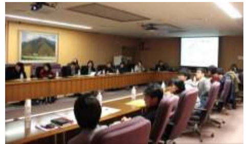
▲熱心に講演に耳を傾ける受講者たち

講演会終了後には、講師と学生の交流会が開催され、企業選びのポイントや企業での研究活動等についての質疑応答が活発になされました。