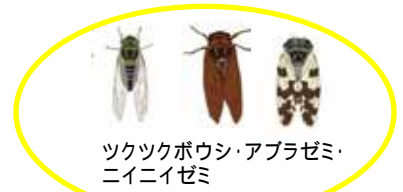
ツクツクボウシ・アブラゼミ・ニイニゼミ

アオスジアゲハ、アサマイチモンジ、ウチワヤンマ、シオカラトンボ、コシアキトンボなど