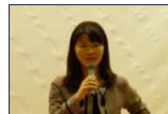
【来賓挨拶: 猪股志野氏(文科省)】