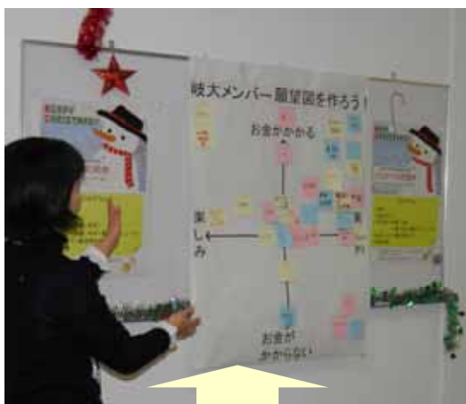
参加者の皆さんに、今一番欲しいものを書いてもらいました。分けをしていって、「お金がかかり、実用的なもの」が多くありました。

平成22年12月22日(水)のランチタイムに男女共同参画推進室主催のクリスマス交流会を開催し、32名の参加がありました。参加者は、男女問わず、学長・教職員・ポスドク・大学院生・学部生とバラエティーに富んだメンバーとなりました。自己紹介の後、ケーキと飲み物を食べながら、ゲームや参加者同士の交流を楽しみました。