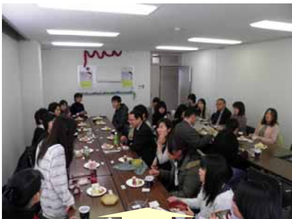
自己紹介の時に、それぞれの今年一番の「MY NEWS」を発表しました。