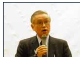
【開会の挨拶: 森 秀樹岐阜大学長】