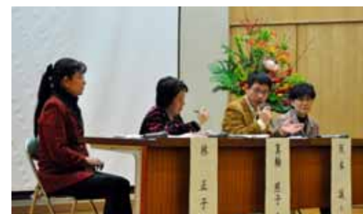
【パネルディスカッション: 左から、林室長・箕輪氏・阪本氏・清島氏】