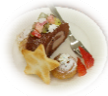
ケーキ盛り合わせ、紅茶・コーヒー・お茶など、好評でした☆