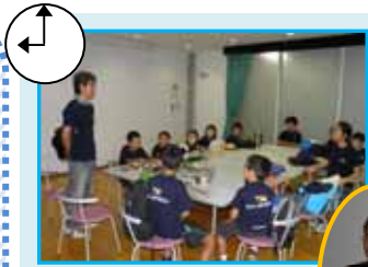
↑[開校式・自己紹介]