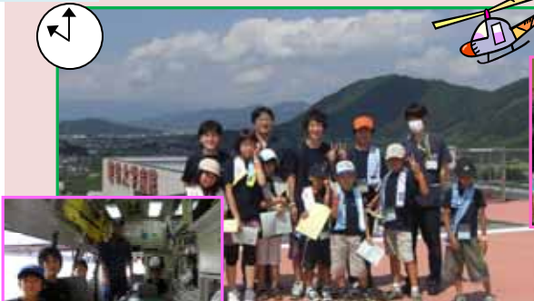
↑[ヘリポート見学][救急車体験乗車] [高次救命治療センター見学]

* 途中で救急車に出動要請がかかり、一部の人が乗車出来ませんでしたが、目の前から出動する姿を見られました。