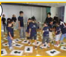
↑[レクリエーション]