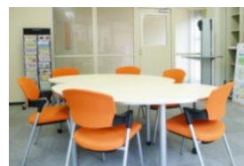
▲ オープンスペース