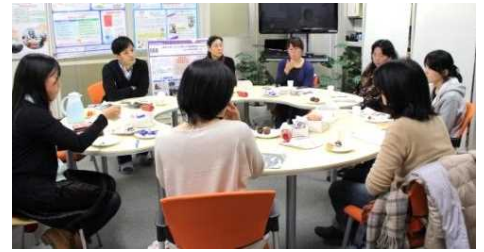
▲わきあいあい、話は終始尽きませんでした。

クリスマス交流会は、男女共同参画推進室の活動紹介とともに、学年や研究科を超えた学生同士そして教員との交流の場となり、参加者は、お互いの研究活動や進学についての情報交換を行いました。同じキャンパスで学び働きながらも、普段は接する機会の少ない人たちと繋がりを持つ良い機会となりました。