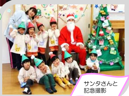
サンタさんと記念撮影

岐阜大学男女共同参画推進室（人材開発部職員育成課男女共同参画係） URL： http://www1.gifu-u.ac.jp/~sankaku/