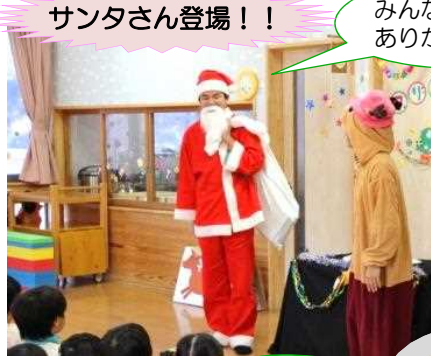
みんな、お手紙ありがとう。