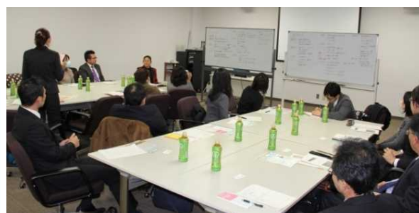
▲ 意見交換会の様子