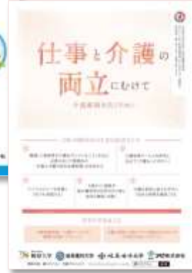
仕事と介護の 両立に向けて 介護離職を 防ぐために