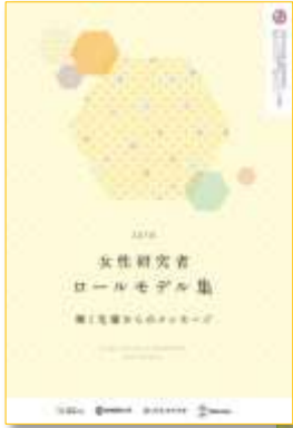
↑ ロールモデル集 2018

https://www1.gifu-u.ac.jp/~kagayaku/data/