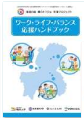
↑ ワーク・ライフ・ バランス応援 ハンドブック