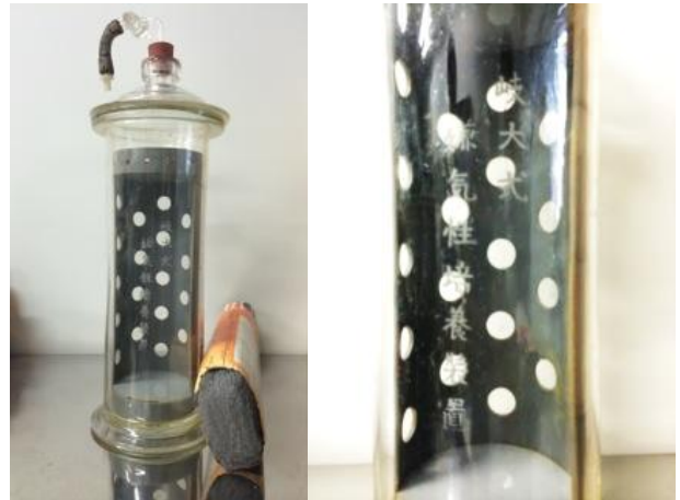
岐大式嫌気培養ジャー

GAM培地 (Gifu Anaerobic Medium) と Fusobacterium 属の鑑別培養のための 変法FM培地