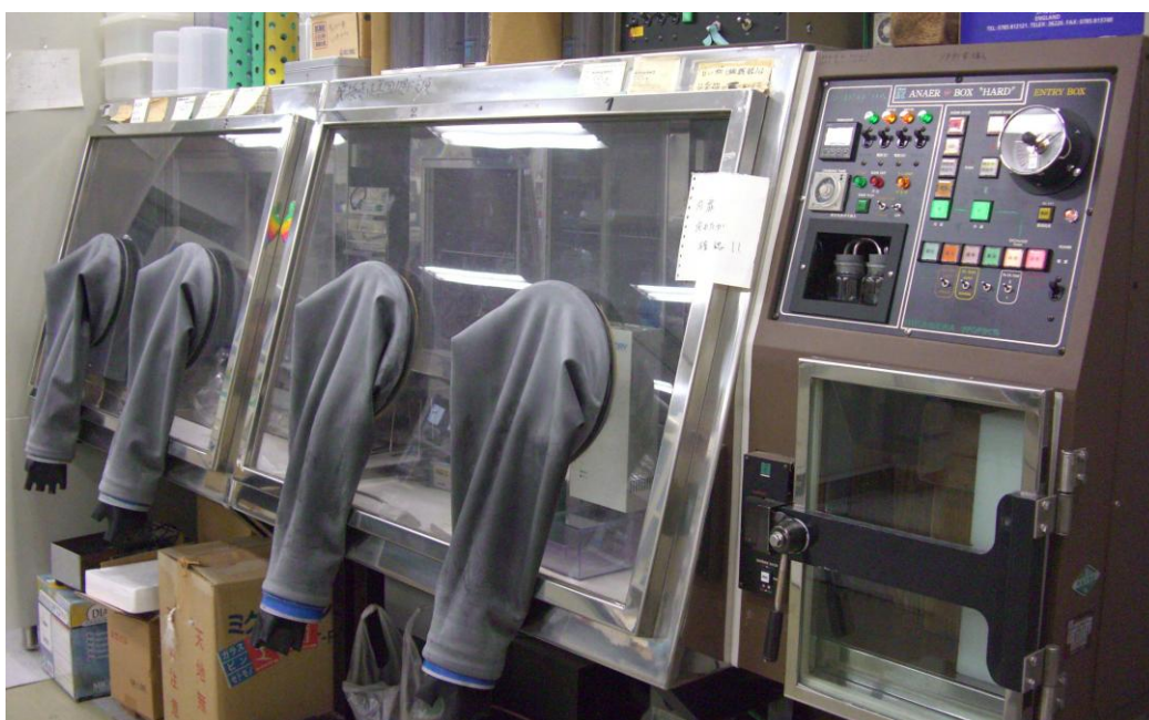
テーパー式アナエロボックス ANX-1W 【平沢製作所】

酸素を含まない混合ガス環境（窒素 82%程度、炭酸ガス 8%程度、水素 10%程度）下での作業、培養が可能