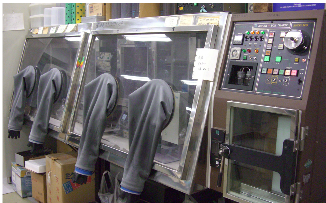
テーハー式アナエロボックス ANX-1W 【平沢製作所】

酸素を含まない混合ガス環境 (窒素 82%程度、炭酸ガス 8%程度、水素 10%程度) 下での作業、培養が可能