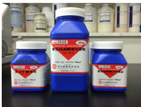
嫌気性菌分離増菌用培地 GAM培地 (Gifu Anaerobic Medium) と Fusobacterium 属の鑑別培養のための 変法FM培地