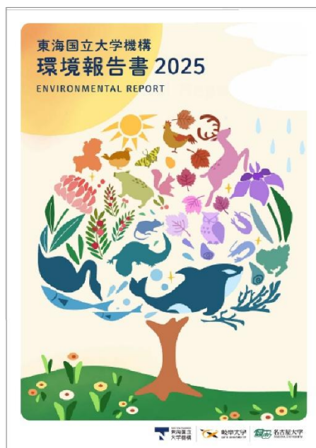
昨年の環境報告書表紙

東海国立大学機構（岐阜大学・名古屋大学）では環境への取組についてを、毎年「環境報告書」として公表しています。 今年も 表紙のイラスト等の公募 を実施します。 皆さまからのご応募をお待ちしております。