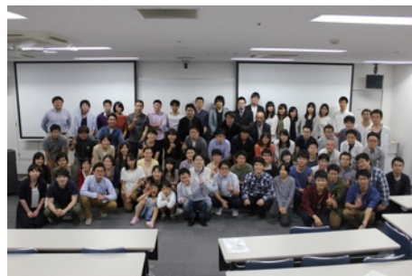
前回もたくさん参加いただきました。

主催：岐阜小児科研修支援グループ (GPI:Gifu Pediatric-residency Initiatives)