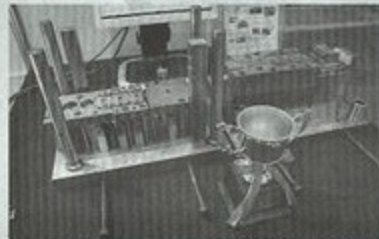
岐阜大学が製作したプレス金型、角絞り品