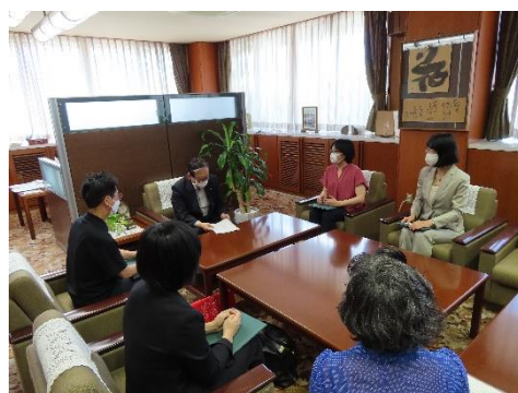
学長と女性研究者との懇談