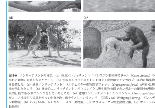
図8-6 エンリッチメントの種類。(a) 採食エンリッチメント: ドレスデン動物園でドール ( Capreolus alpinus ) の群れに動物の死骸を与えたところ。(b) 空間エンリッチメント: トロント動物園でアシカのプール内に構築物を設置したところ。(c) 感覚エンリッチメント: コルチェスター動物園でフォッサ ( Cryptoprocta ferax ) が匂いに興味を示したところ。(d) 社会的エンリッチメント: サウスレイクス野生動物公園でカンガルーの雄同士が種特異的行動であるボクシングをしているところ。(e) 認知エンリッチメント: チンパンジー ( Pan troglodytes ) が人工リ塚から道具を使って中身を取り出そうとしているところ。