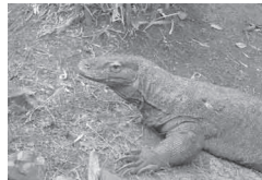
図9.4 動物は有性生殖もしくは単為生殖により繁殖する。コモドオオカゲはごく最近単為生殖を行う種のリストに加えられた。