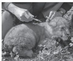
図11-11 ワクチン接種は、生ワクチンに関連した潜在的リスクのため、動物園で広く実施されているわけではないが、動物園で実践可能な予防医学の1つである。現在では、猫の不活化ワクチンがライオンやトラのような大型ネコ科動物で標準的に用いられている。この写真は、イスラエルのアマリオン動物園でライオンの赤ちゃんに定期的なワクチン接種を行っている様子である。

動物園であり広く使用されているワクチンには、狂犬病（英国内では発生がない）、犬ジステンパー（いくつかの種で報告されているジステ