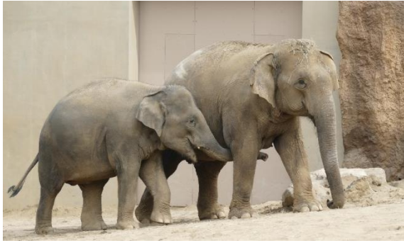
図2 円山動物園のアジアゾウ（左が当時6歳の雌）