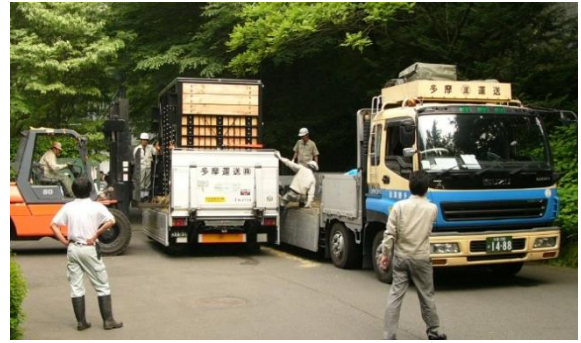
図3 動物園内でのトラックからトレーラーへの輸送箱の積み替え（写真はアフリカゾウの輸送時、2006年撮影）