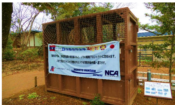
図2 京都市動物園にラオスから贈られたアジアゾウの輸送箱の実物