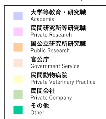
論文博士（割合表） Doctoral Dissertation Program Graduates