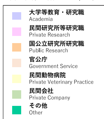
論文博士（割合表） Doctoral Dissertation Program Graduates