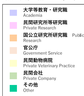
論文博士（割合表） Doctoral Dissertation Program Graduates