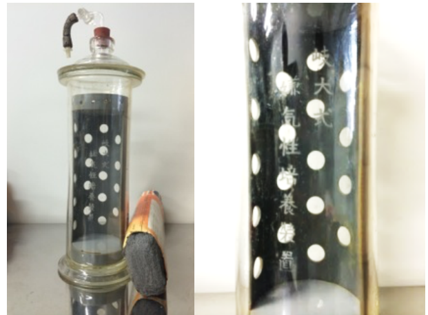
岐大式嫌気培養ジャー

GAM培地 (Gifu Anaerobic Medium) と Fusobacterium 属の鑑別培養のための 変法FM培地