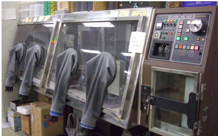
テーハー式アナエロボックス ANX-1W 【平沢製作所】 他 1 台

酸素を含まない混合ガス環境（窒素 82%程度、炭酸ガス 8%程度、水素 10%程度）下での作業、培養が可能