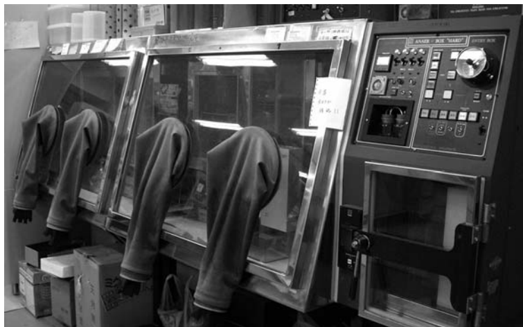
テーハー式アナエロボックス ANX-1W 【平沢製作所】

酸素を含まない混合ガス環境（窒素82%程度、炭酸ガス8%程度、水素10%程度）下での作業、培養が可能