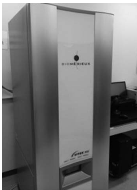
VITEK MS Plus 【ビオメリュー】