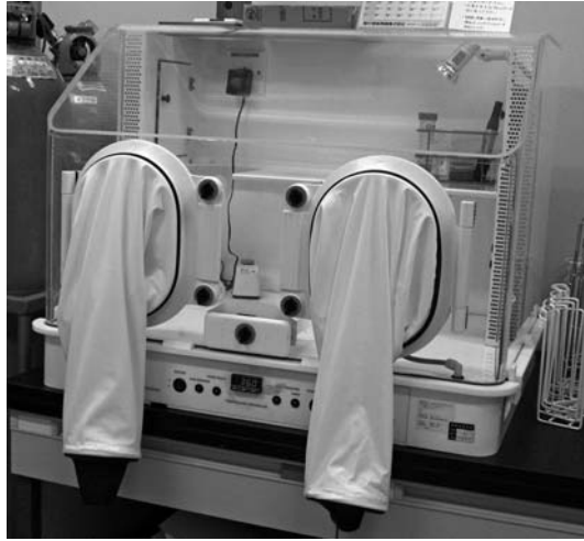
嫌気ワークステーション miniMACS 【Don Whitley Scientific (GSI クレオス/コージンバイオ)】