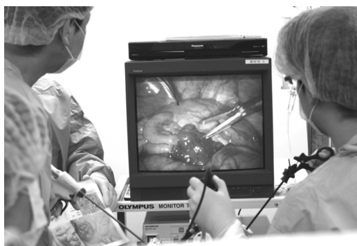
医師向けのブタを用いての内視鏡外科手術トレーニングセミナーを開催。参加者 31 名。（左：ブタに対する吸入麻酔処置、右：内視鏡を用いての施術トレーニングの様子）