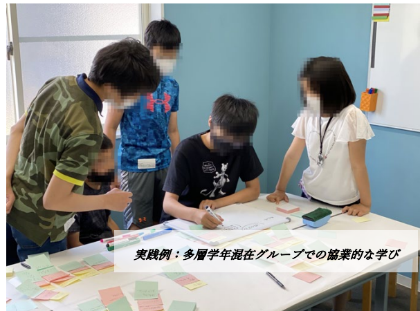
実践例：多層学年混在グループでの協業的な学び

※授業日程は変更になることがあります。 ※全4回、全ての集中講義に出席することが単位取得の一つの条件となります。 ※第1・2・4回の開講場所は岐阜大学内、第3回のイベント実践会場は羽島市中央公民館（不二羽島文化センター）の予定です。