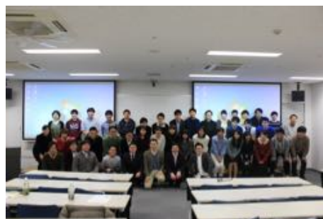
昨年度もたくさん参加いただきました。

主催：岐阜小児科研修支援グループ (GPI:Gifu Pediatric-residency Initiatives)