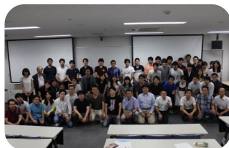
第2回にもたくさん参加いただきました。

主催：岐阜小児科研修支援グループ (GPI:Gifu Pediatric-residency Initiatives)