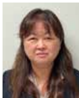
Guコンポジット研究センター、工学部機械工学科