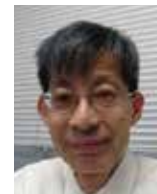
Guコンポジット研究センター、工学部化学・生命工学科