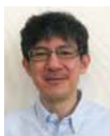
Guコンポジット研究センター、工学部化学・生命工学科