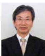
Guコンポジット研究センター、工学部化学・生命工学科

繊維/樹脂界面の界面特性は、複合材料の性能も寿命をも制御する。界面をはじめ構成材料を自在に操ることで、テラードマテリアル/テラードデザインを実現する。これにより、複合材料の性能を操り、人体に適合する運動補助具や装具を開発したり、破壊を操り、モノの寿命を延伸したり、あらゆる分野の応用展開に貢献します。