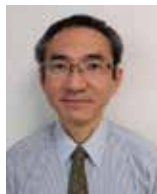
Guコンポジット研究センター、工学部機械工学科