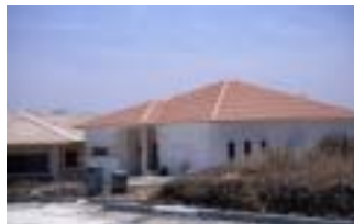
キブツ集団農場の住宅