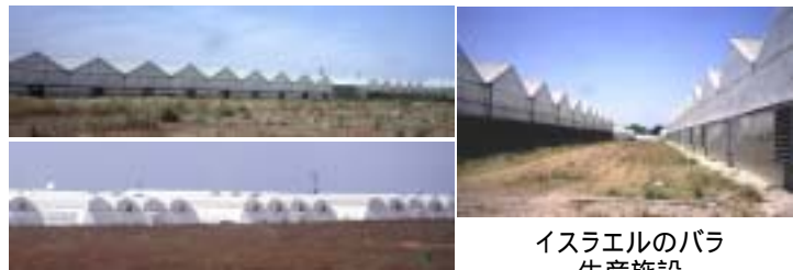
イスラエルのバラ生産施設