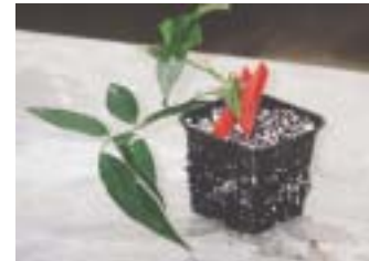
オドラータ台木の接ぎ挿し苗