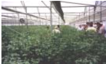
施設内でのバラ生産状況