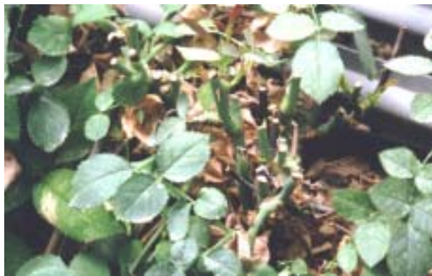
1株からの切花状況(切口がかなり多いことが判る。8～10本?)