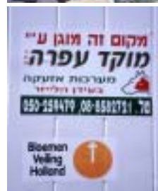
オランダ系養分分析会社による単肥配合