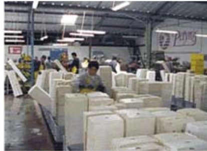
15°Cに空調された選花室で選花、立箱梱包が行われる