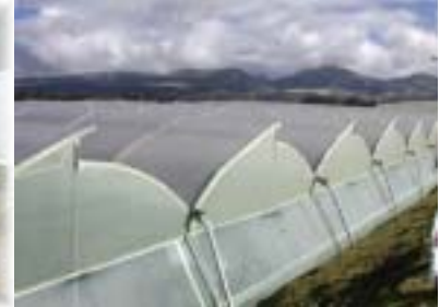
最新式の大型パイプハウス