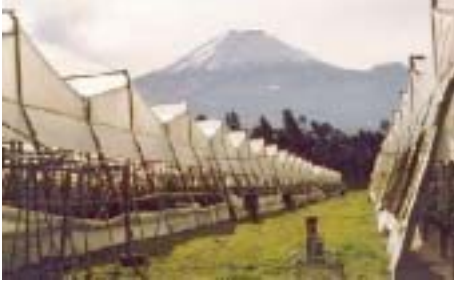
ビニルを張った木造のハウスで、遠くにCotopaxi山がみえる