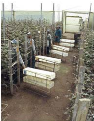
栽培方式は土耕栽培で、豊富な労働力を活用して収穫が行