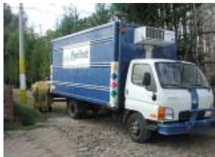
空港までの輸送は保冷車で行われる