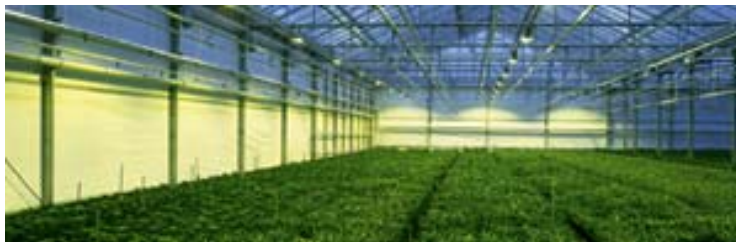
オランダの補光栽培